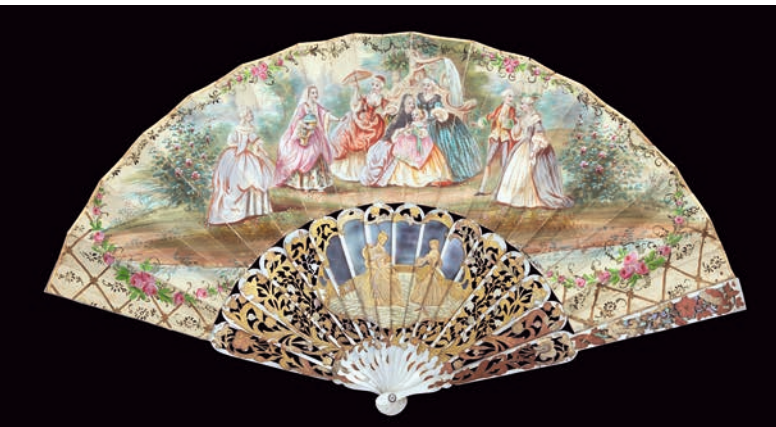
▲ Détente au jardin . Éventail plié à feuille en peau, monture en nacre repercée, gravée et dorée, réalisé vers 1850.