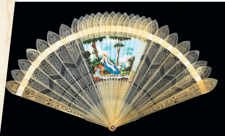
▲ Éventail dit double-détente ou quatre images, type brisé, corne repercée et gouachée, vers 1820.