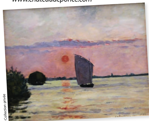
◀ La Martinière le soir , huile sur toile de 1891.

Maxime Maufra, de Pont-Aven à la vallée du Loir , au château de Poncé, 8 rue des Coteaux. Ouvert les mercredi, jeudi et vendredi, de 14 h 30 à 18 h 30, et le week-end, de 10 h 30 à 12 h 30 et de 14 h 30 à 18 h 30. Tél. 06 72 80 67 35. www.chateauPONCE.com