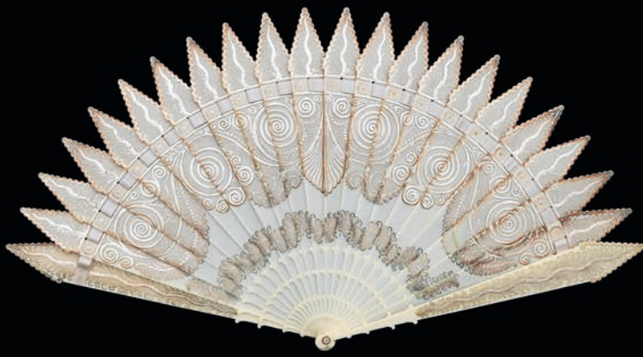
▲ Volutes . Modèle de type brisé, en ivoire, vers 1810-1820.