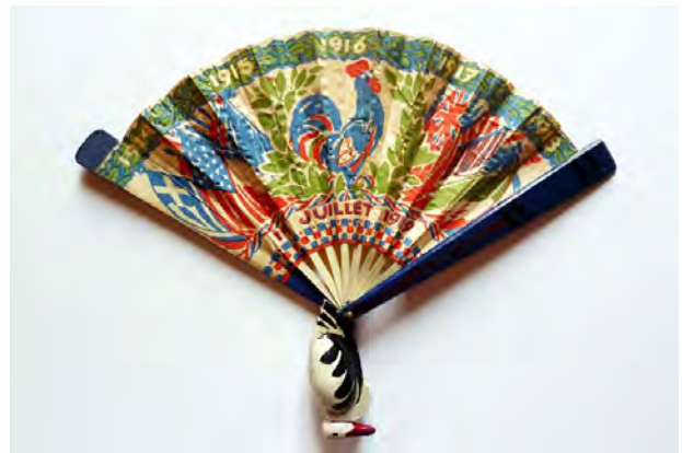
Photo 1 : éventail de l'artiste Thomasse et de l'éventailleur Duvelleroy, célébrant la France libérée et la victoire des alliés. On y voit le coq gaulois perché sur un canon de 75, chantant le nouveau jour qui se lève sur une France libre. La feuille est en soie, signée. La monture est en écaille, le panache figurant une hampe de drapeau et les brins sont sculptés des blasons des Alliés, hauteur: 22 cm, 1800 €

Photo 2 : Il s'agit d'un éventail commémoratif de la guerre de 1914-18, créé pour le défilé de la Victoire du 14 juillet 1919. La monture est en bois figurant une cigogne, la feuille est en papier, imprimée du coq de la victoire et des drapeaux des Alliés. Hauteur : 29 cm, 800 €